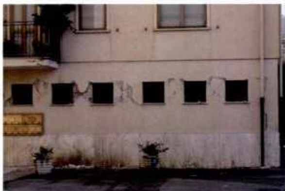
Pilastri tozzi con rottura a taglio