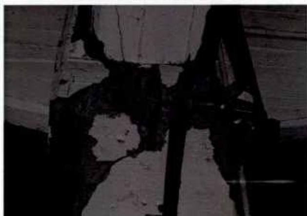
Finestre a nastro e danno a pilastro