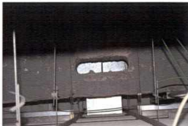
Bucature travi in cemento armato per passaggio canali climatizzazione