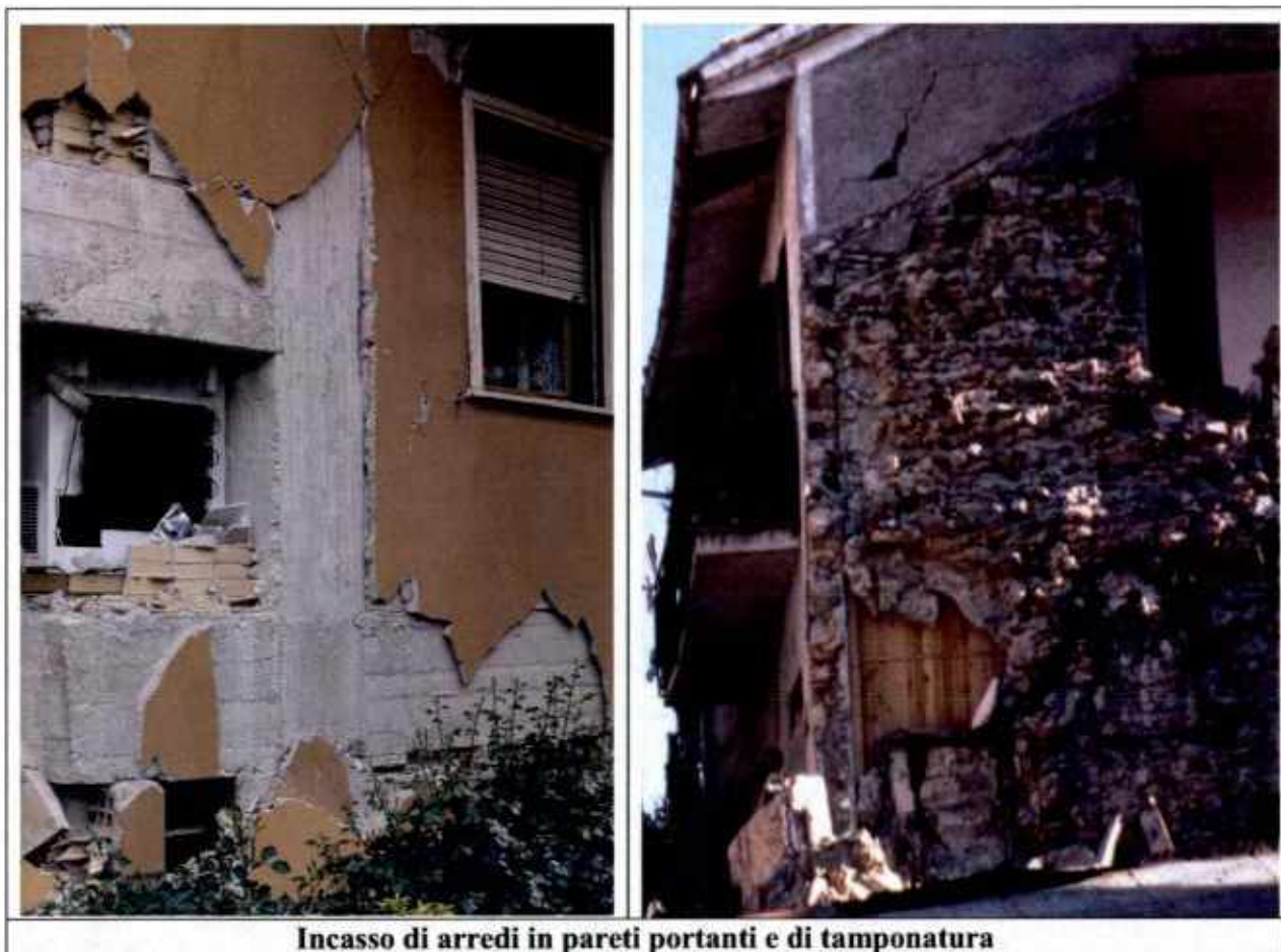
Incasso di arredi in pareti portanti e di tamponatura