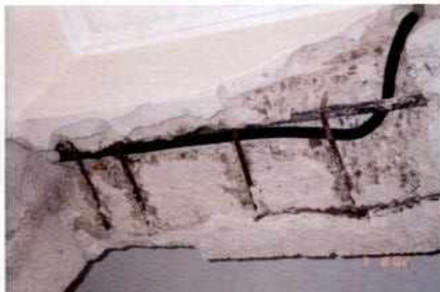
Distruzione della sezione di una trave in cemento armato per l'inserimento di cavidotti