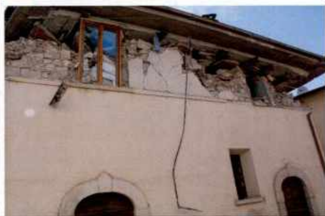
Finestre prive di architrave e stipiti