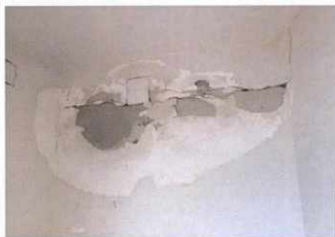
Cassette impiantistiche inserite all'interno di pareti interne