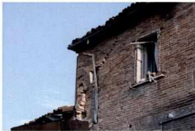
Bucatura muratura portante per passaggio canna fumaria