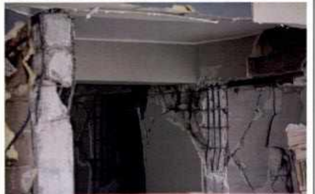
Piani porticati ed aggravamento del danno a causa di aumentata vulnerabilità sismica da "piano soffice"