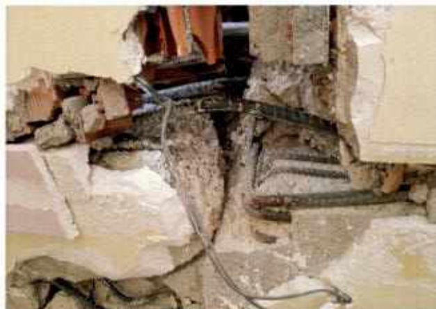
Cavi elettrici inseriti nella sezione resistente di una trave