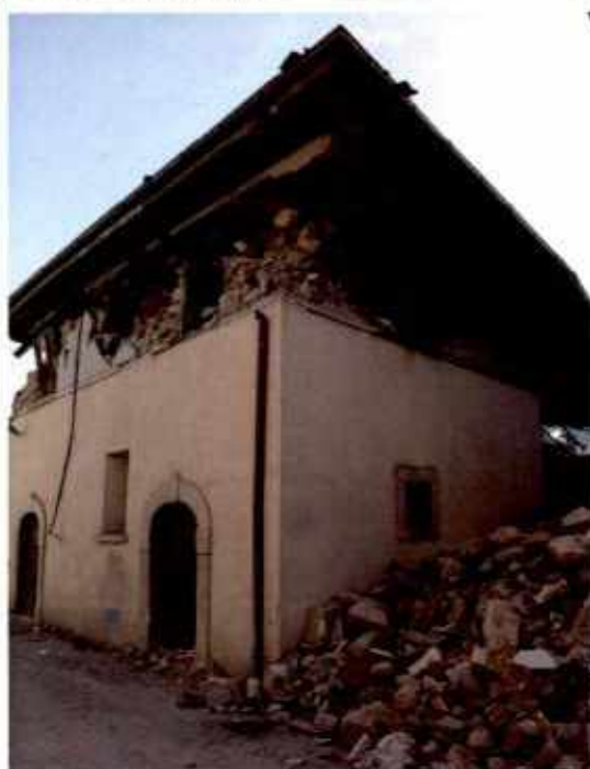
Sostituzione copertura a tetto che ha appesantito il fabbricato