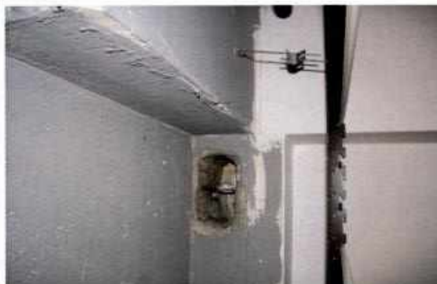
Bucatura pilastro per inserimento cassetta