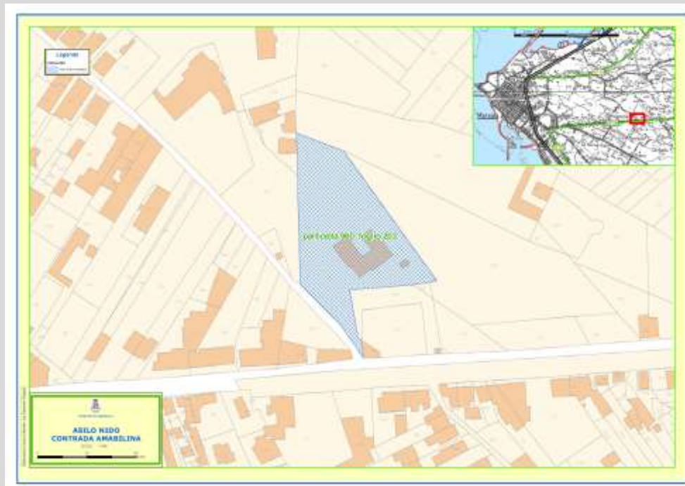
Figura 1 – Planimetria Catastale

L'area di intervento è identificata nel Piano Peep del Comune di Marsala come attrezzatura di interesse collettivo.